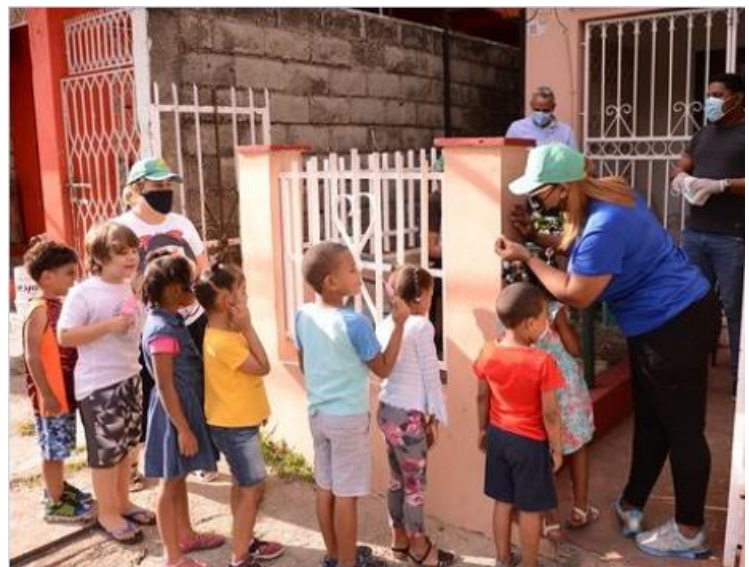
Los núcleos de Capotillo y Villas Agrícolas realizaron este jueves 25 de febrero en horas de la tarde una jornada de desparasitación de niños y adolescentes que busca ayudar a mejorar la salud y nutrición de esta población.