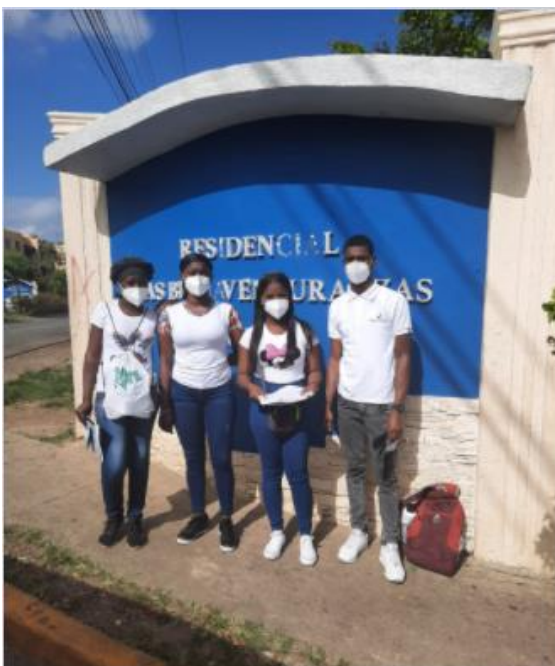
Jóvenes afiliados de Alianza País, del Núcleo de Guaricano, en jornada comunitaria, como parte de la campaña CERO COVID-19. Alianza País educa su militancia en el compromiso social.